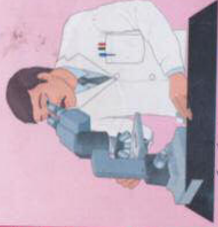
بررسی نمونه بوسیله میکروسکوپ

ابتدا خانمسی که می خواهد آزمایش بدهد روی تخت مخصوص معاینه زنان می خوابد و مانا یا پزشک ترشحات دهانه رحم را که حاوی سلول است برمیدارد . این کار معمولاً هیچگونه دردی ایجاد نمیکند . و حدود یک دقیقه طول میکشد . بسی نمونه برای بررسی به آزمایشگاه ارسال میگردد